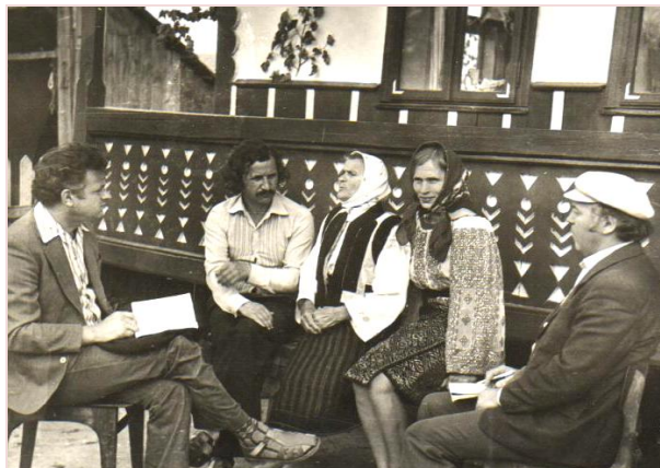
Crăsnioara, Storojineț, reg. Cernăuți, inf. Haciman, culeg.: Victor Cirimpei, Sergiu Moraru, Efim Junghietu (1982)